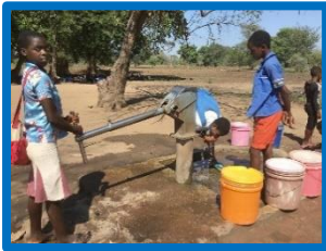
Een waterpomp in 2021;

Hiervoor werden in 2021 door de Stichting 1000 bruikbare mobieltjes en iPads en laptops ingezameld , die in Malawi gebruiksklaar werden gemaakt en uitgedeeld.