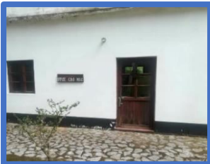
Een kantoor voor de CBO-organisatie in 2022;