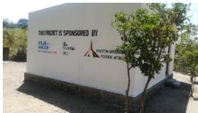
Een internetgebouw in 2022.