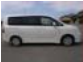
De aanschaf van een minibus in 2022.