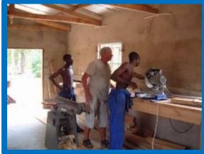
De werkplaats in 2008;

De actie How to help our community to communicate: